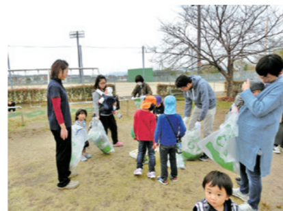
ご近所のママ友たちで公園の清掃をされました。